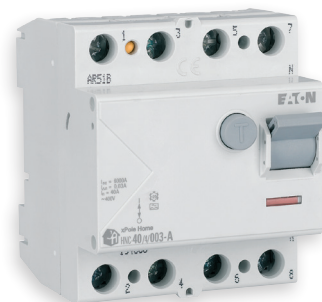
Wyłączniki różnicowoprądowe HNC