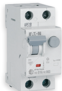
Wyłączniki kombinowane HNB