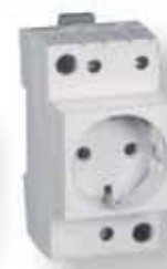
t-2P+Z Schuko P